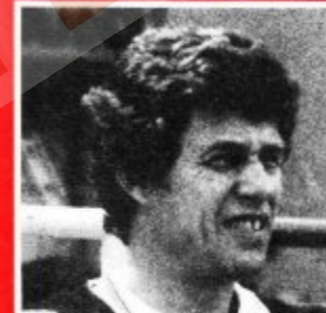
Trainer Otto Rehhagel