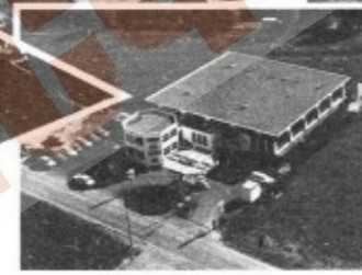
Werk 3 7460 Balingen-Engelstätt