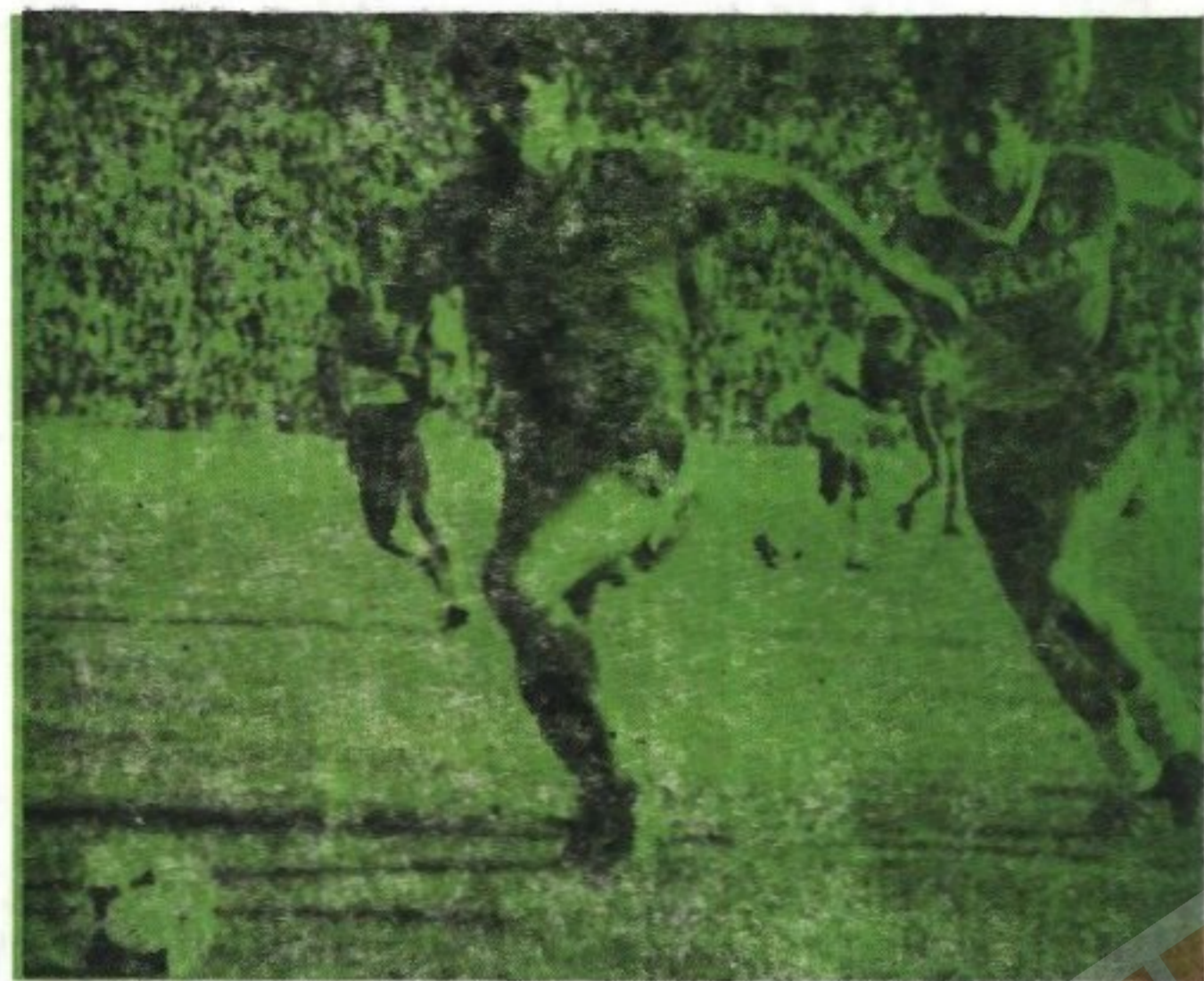
Mănăilă în plină acțiune