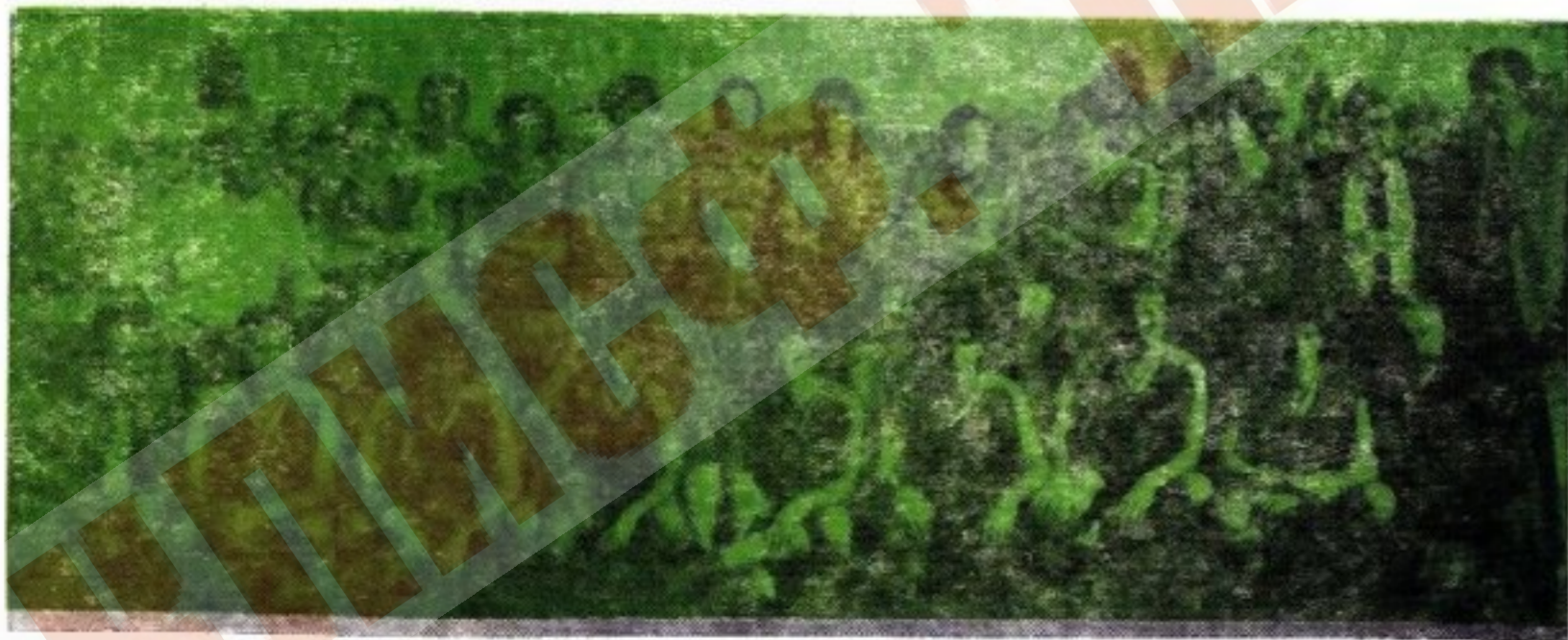
Clipe de bucurie, A.S. Monaco K.O. la Craiova!