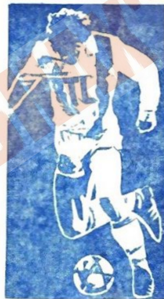
● FOTBAL meridiane