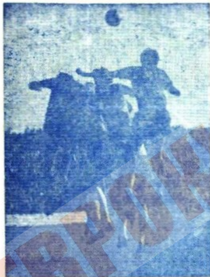
● FOTBAL meridiane

● După cum s-a mai anunțat, în urma incidentelor petrecute pe stadionul „Heyssel”, din Bruxelles, în finala C.C.E., dintre F. C. Liverpool și Juventus Torino, U.E.F.A. a dispus ca echipa italiană să susțină două jocuri pe teren propriu cu porțile închise. Președintele clubului italian, Giampiero Boniperti, a făcut un memoriu la forul european, pentru ca meciul retur cu Verona, programat la Torino, în cadrul C.C.E., să fie măcar televizat în direct, aceasta pentru a evita unele eventuale urmări ce s-ar putea ivi între suporterii celor două echipe la porțile stadionului. Forul european a aprobat cererea echipei torineze. ● După ce Zico, Falcao și Socrates au părăsit Italia revenind în Brazilia, connazionali lor nu mai manifestă mare interes pentru campionatul italian de fotbal. Ziarele braziliene anunță lapidar doar rezultatele din „calcio”, vîrînd atenția cititorilor spre campionatele spaniol și portughez.