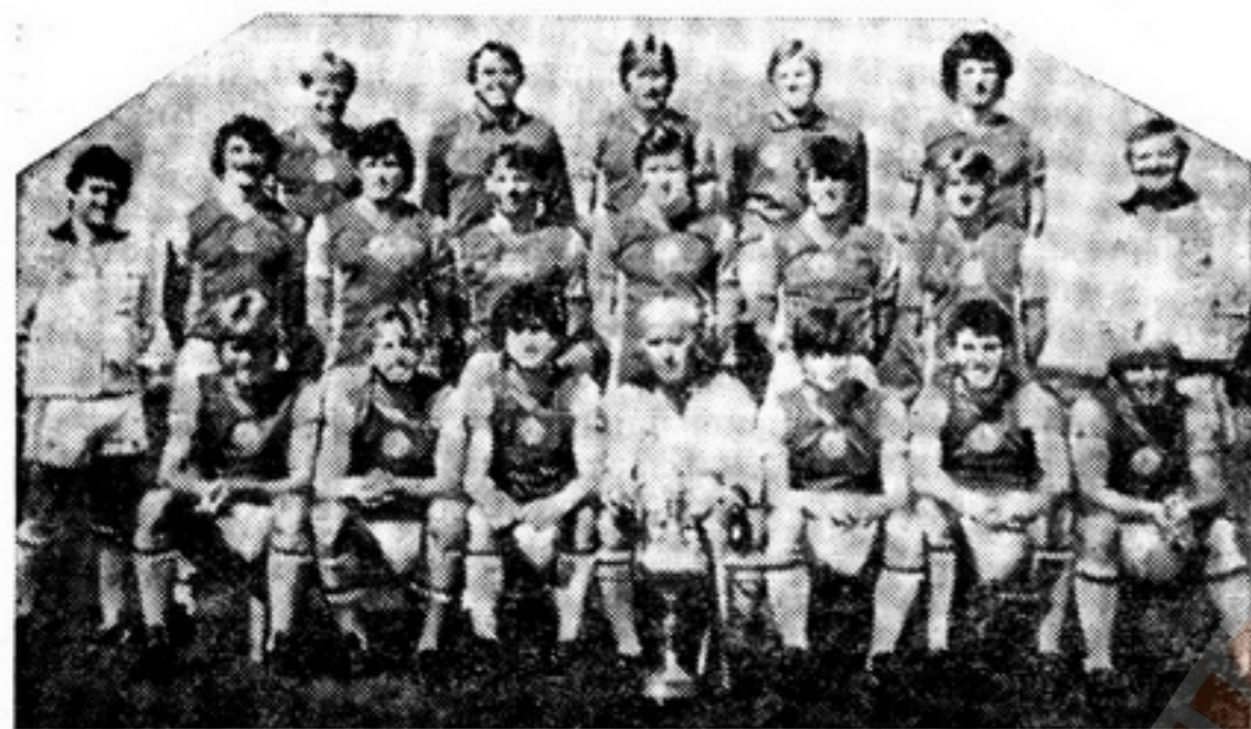
«Астон Вилла» — обладатель Кубка европейских чемпионов 1981/82 г.

Клуб «Астон Вилла» — один из старейших в Англии, ему более 100 лет. Основан был в 1874 г. в Бирмингеме прихожанами церкви «Астон Вилла Уэслэйен». В 1885 г. принял статус профессионального клуба. В первом же чемпионате страны (1889 г.) стал 2-м призером. В 1894 г., когда футбол