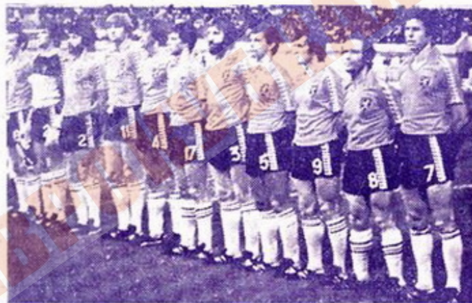
Сборная Бельгии — серебряный призер чемпионата Европы 1980 г.

«Локерен» по составу интернациональная команда. Помимо бельгийцев в ней немало игроков из других стран. Вратарь Боб Хоогенboom — из Голландии. В линии атаки выступают 19-летний Арнор Гудйонссон (игрок сборной Исландии), 23-летний Пребен Ларсен,