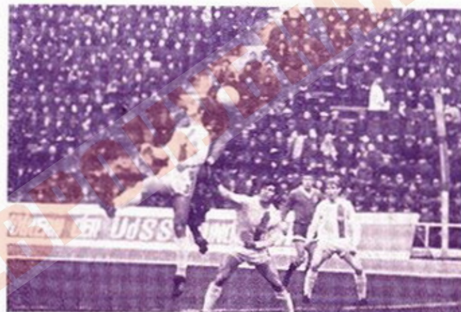
В матче Кубка кубков 1971/72 г. встречаются московское и берлинское «Динамо»

ные всеми клубами в трех турнирах за все предыдущие пять лет, суммируются и делятся на число команд, участвовавших в этих соревнованиях от одной страны. Так вычисляется своеобразный «коэффициент успеха», который высчитывается до тысячных долей. Если коэффициенты у двух стран окажутся одинаковыми, то свое решение в случае необходимости вынесет УЕФА.