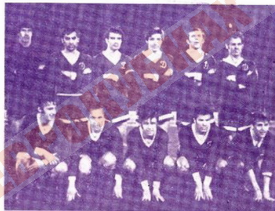
«Динамо» (Москва) — финалист Кубка обладателей кубков 1971/72 г.