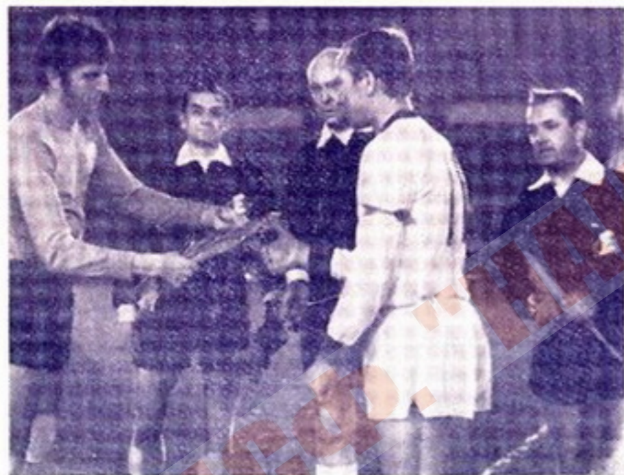
Кубок кубков 1971/72 г. Приветствие капитанов команд перед матчем московского «Динамо» с турецким клубом «Эскишехирспор».

Состав команды-победительницы: Паль, Эрмантраут, Нойбергер, Кёрбель, Пещай, Лорант, Хельценбайн, Нахтвайс (Шауб), Борхерс, Никель, Бум Кун Ча.