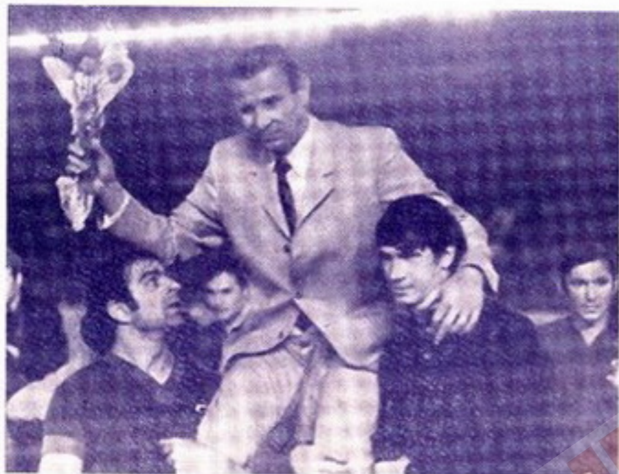
Так провожали из большого футбола Льва Яшина