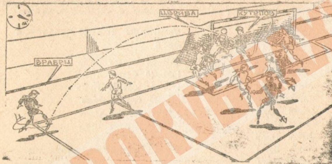
Спарта — Динамо Киев. 21 минута Врабец № 4 — 2:0.