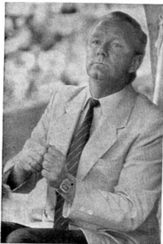
В. Лобановский — старший тренер сборной СССР и киевского «Динамо».