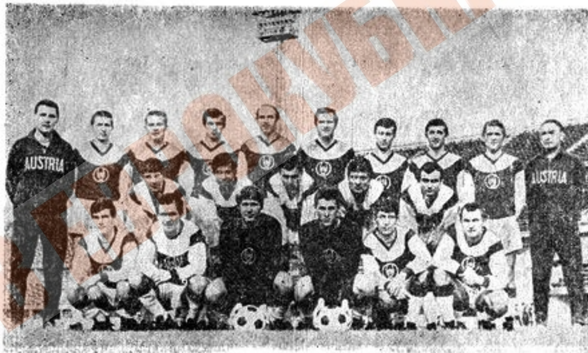
ФУТБОЛ В АВСТРІЇ

Колір клубу — ліловий. Заснований 1911 року. Чемпіон Австрії 1949, 1950, 1953, 1961, 1962, 1963, 1969 рр. 7 разів займав друге і 11 разів — третє місце. 12 разів здобув Кубок Австрії.