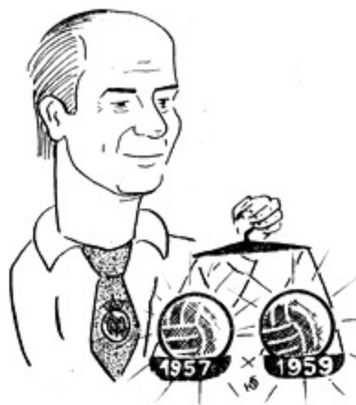
Золотые мячи Алфредо Ди Стефано

Именно при Бернабеу была сформирована великолепная команда во главе с знаменитым аргентинским центрфорвардом Альфредо ди Стефано. Тогда в 50—60-х годах, в «Реале» собралось целое созвездие блистательных мастеров: француз Копа, уругваец Сантамария, венгр Пушкаш, бразилец Диди, швед Симонссон, испанцы Хенто, Дель Соль, Амансио, Санчис и др.