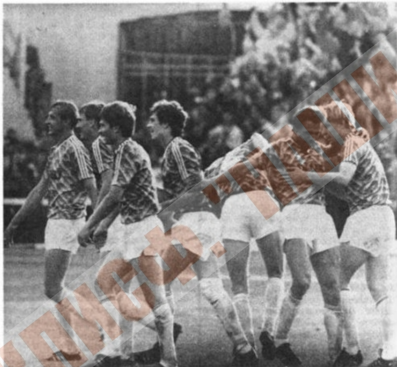
Džiaugsmo akimirka: ką tik kamuolys įkriejo į „Austrijos“ vartus.

Atvykę į Vieną, „Kronencaitung“ perskaitė „Austrijos“ žaidėjų ir trenerių prognozes. H. Prohaska, komandos kapitonas: „Vilniečių silpni