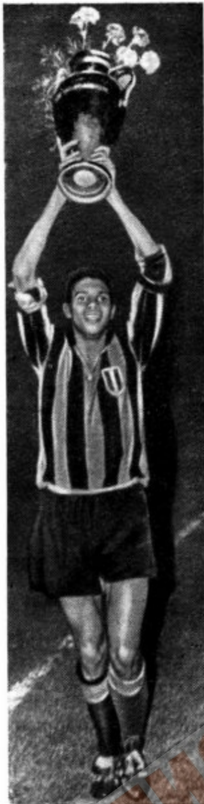
Нападающий итальянской команды «Интернационале» бразилец Жаир с Кубком европейских чемпионов, завоеванным его клубом

взгляд суховатого, но гармоничного и целиком устремленного на борьбу и победу современного футбола.