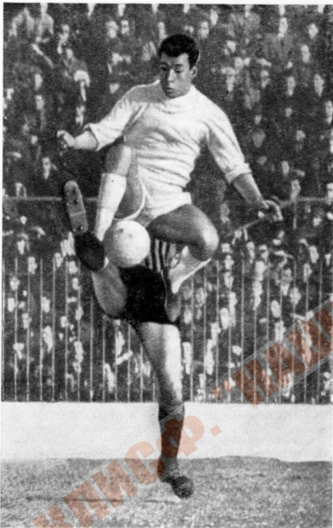
Правый крайний нападающий испанского клуба «Реал» и сборной Испании Амансио в прыжке забивает гол в ворота «Интернационале» (Италия) в полуфинальном матче на Кубок европейских чемпионов