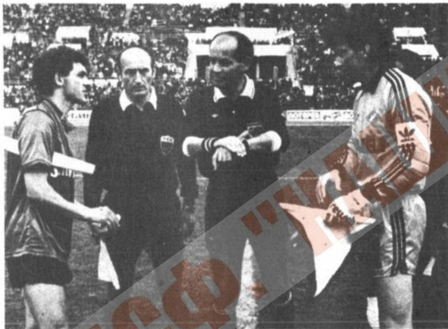
Приветствие капитанов московского «Спартака» и северо-ирландского «Гленторана».

Впрочем, судите сами. В сезоне 1987/88 г. мы впервые добились права заявить в Кубке УЕФА четыре команды, а всего осенью в борьбу за призы всту-