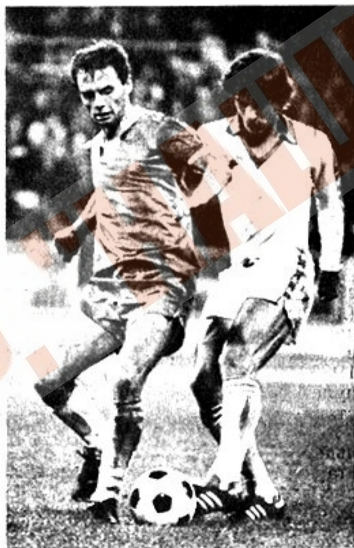
Свой последний матч на Кубок УЕФА московское «Динамо» сыграло с польской командой «Шленск» (Вроцлав). На снимке: эпизод матча.