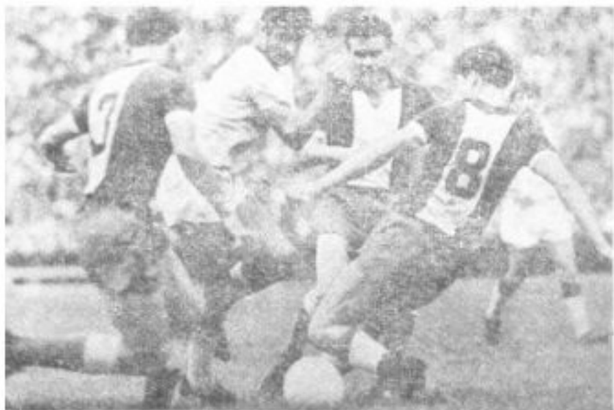
Часом і один вартий сімох.

Поляки ж поводитись інакше. Вони розуміли, з ким мають справу, і грали рішуче, вдаючись до пресингу по всьому полю. Юний Любанський зачарував усіх. Його білявий чуб бачили то на лівому, то на правому фланзі. А ще за хвилину невгамовний Влодек таранив київську оборону по центру. Агресивний, азартний, наполегливий, він майже незмінно виходив переможцем у поєдинках з динамівськими захисниками, демонструючи широку й змістовну гру. І таки забив «свій» м'яч.