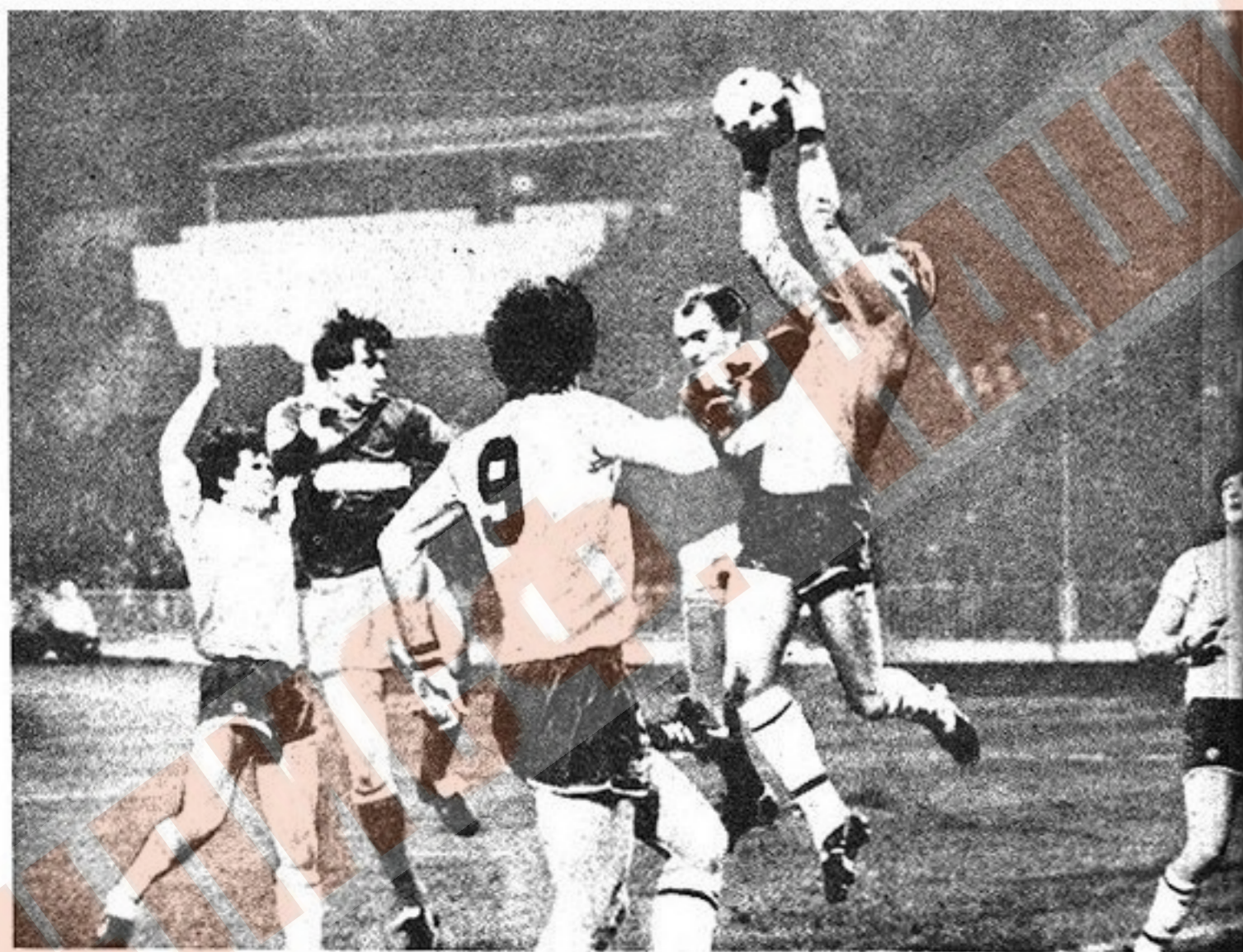
Кубок УЕФА. Давление «Спартак» на ворота «Астон Виллы»