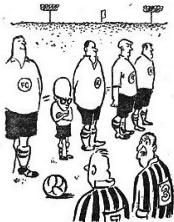
— Послушай, надо внимательно следить за этим типом. Говорят, это мозг команды.

матче. Может быть, так и надо готовиться к турниру, но к одному матчу? Самая, лучшая подготовка — это игры чемпионата страны. Футболисты находятся в игровом режиме, не нарушается ритм тренировочной работы. Трудно, чтоб не сказать невозможно, вспомнить случай, когда в связи с матчем на европейский Кубок была бы отменена какая-нибудь игра «Интера», «Реала» или «Бенфики» (нарочно перечисляю победителей) на первенство страны. Если предстоит далекий маршрут или соперник очень силен, внутренние встречи изредка играют на день раньше. Думается, и нам нет резона пренебрегать опытом ветеранов этих турниров.